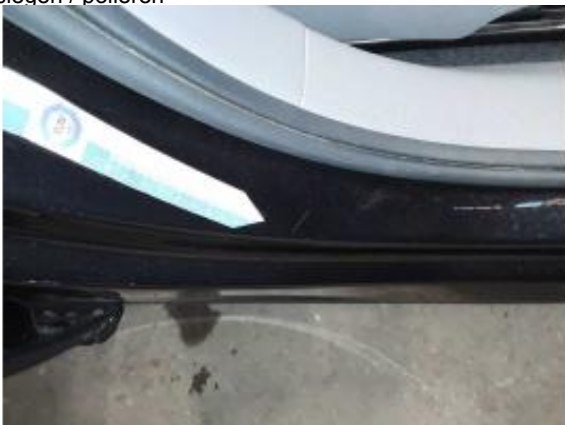
Beschädigung 3: Schweller rechts: Einstieg - Kratzer - auslegen / polieren