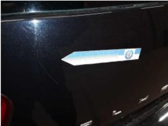
Beschädigung 1: Heckklappe/-tür: Heckklappe - Kratzer - auslegen / polieren