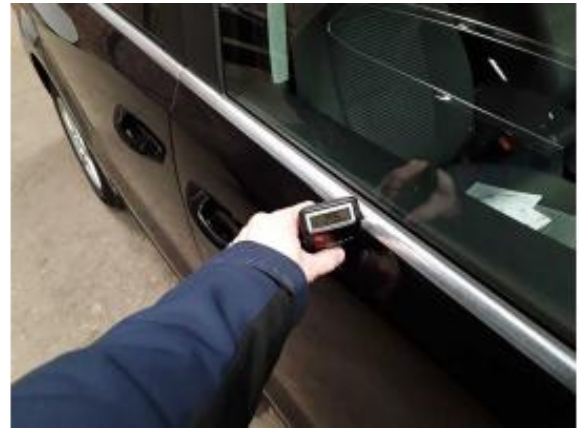
Nacklackierung 1: Seitenwand rechts, Tür vorne rechts