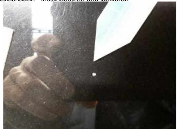
Beschädigung 11: Motorhaube: Motorhaube - Delle / Lackschaden - instandsetzen und lackieren