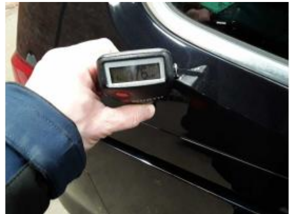
Nacklackierung 1: Seitenwand rechts, Tür vorne rechts