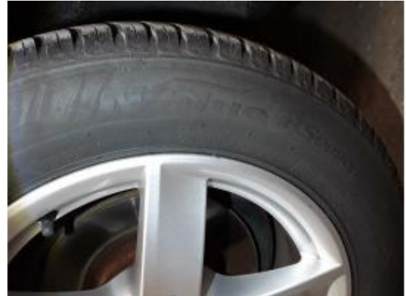
Fehlteil #1: Ausrüstung: Tirefit komplett (Reifensatz ohne Polymerbeschichtung) - fehlt - erneuern