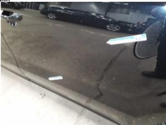
Beschädigung 7: Tür hinten links: Tür - Delle / Lackschaden - instandsetzen und lackieren