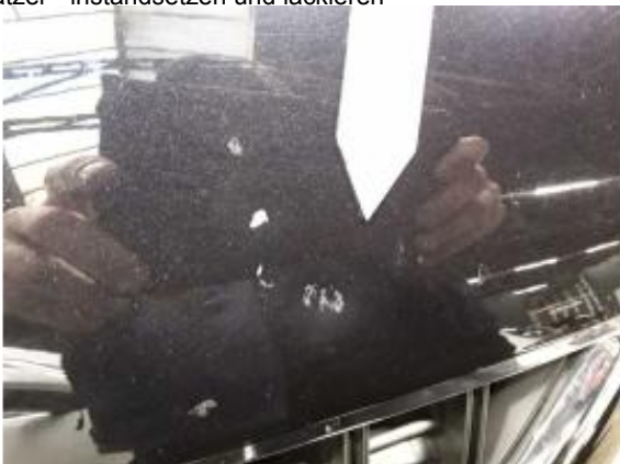
Beschädigung 11: Motorhaube: Motorhaube - Delle / Lackschaden - instandsetzen und lackieren