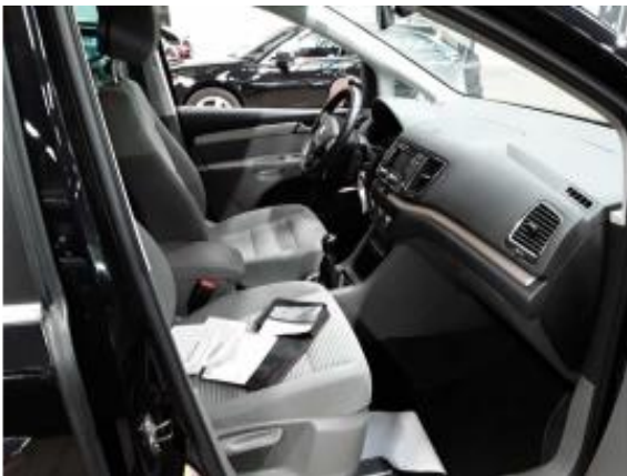
Abbildung 5: Innenraum