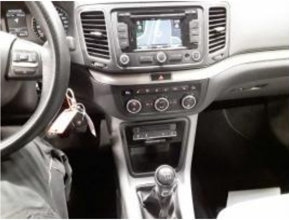
Abbildung 9: Innenraum