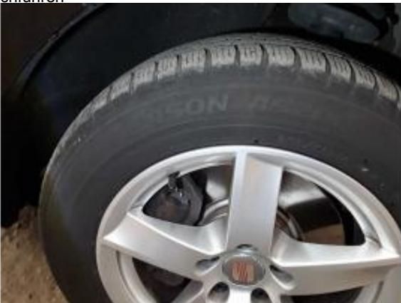
Fehlteil #1: Ausrüstung: Tirefit komplett (Reifensatz ohne Polymerbeschichtung) - fehlt - erneuern