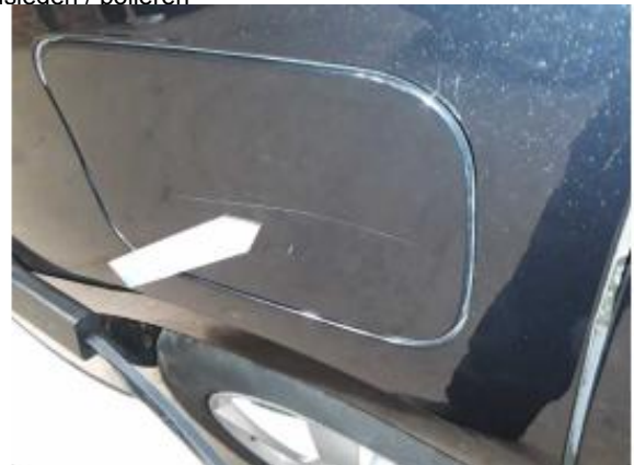
Beschädigung 2: Kraftstoffanlage: Tankdeckel - Kratzer - auslegen / polieren