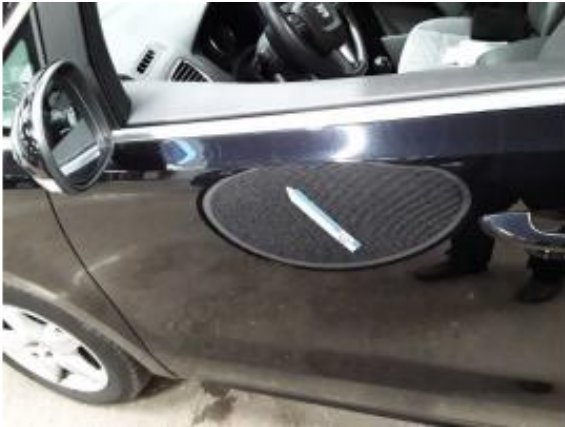
Beschädigung 4: Tür vorn links: Tür - Dellen - sanft instandsetzen