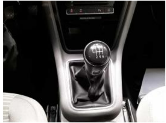
Abbildung 10: Innenraum