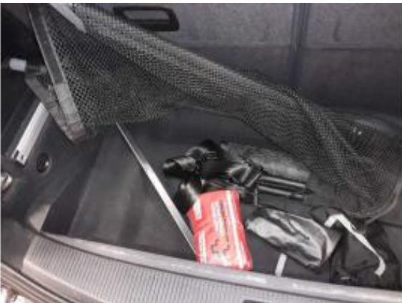
Abbildung 13: Sonstiges