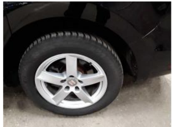
Abbildung 18: Räder/Reifen