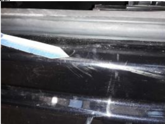
Beschädigung 5: Schweller links: Einstieg - Kratzer - Smart Repair