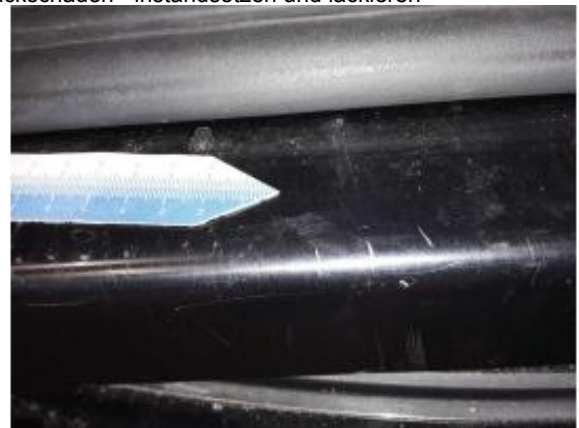
Beschädigung 8: Seitenwand links: Einstieg - Delle / Lackschaden - instandsetzen und lackieren