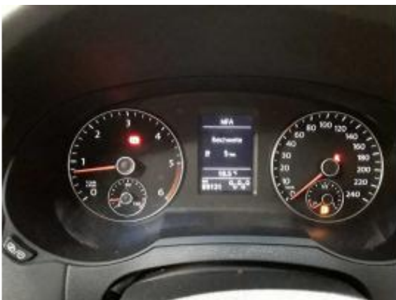
Abbildung 7: Innenraum