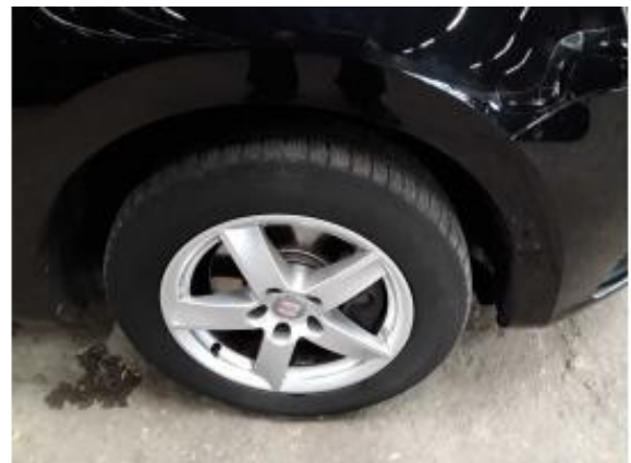
Abbildung 16: Räder/Reifen