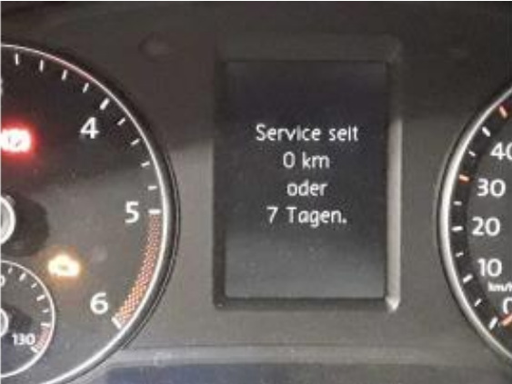
Beschädigung 12: Sonstiges: Inspektion/Wartung - fällig - durchführen