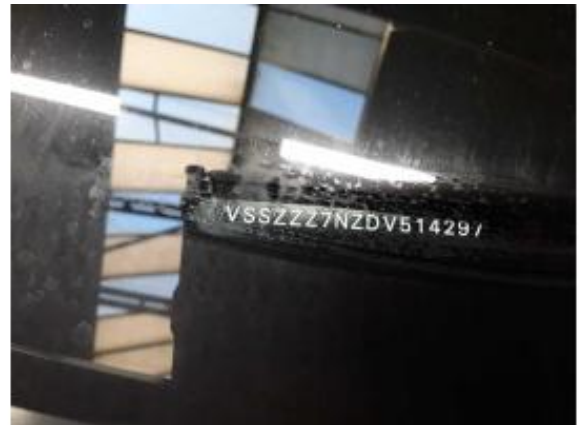
Abbildung 14: FIN / Typenschild