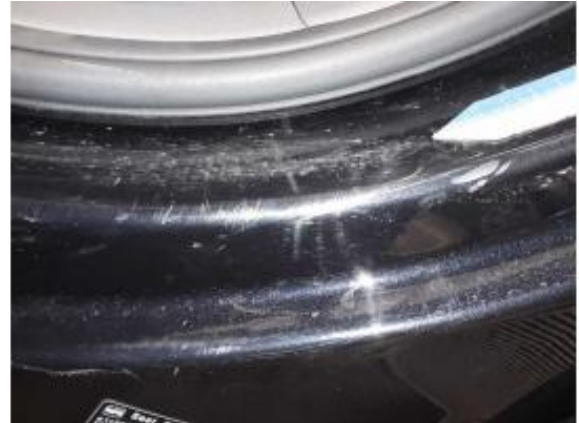
Beschädigung 5: Schweller links: Einstieg - Kratzer - Smart Repair