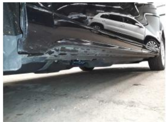
Abbildung 24: Schweller