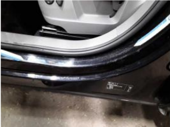
Beschädigung 5: Schweller links: Einstieg - Kratzer - Smart Repair