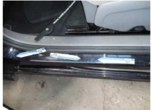
Beschädigung 8: Seitenwand links: Einstieg - Delle / Lackschaden - instandsetzen und lackieren