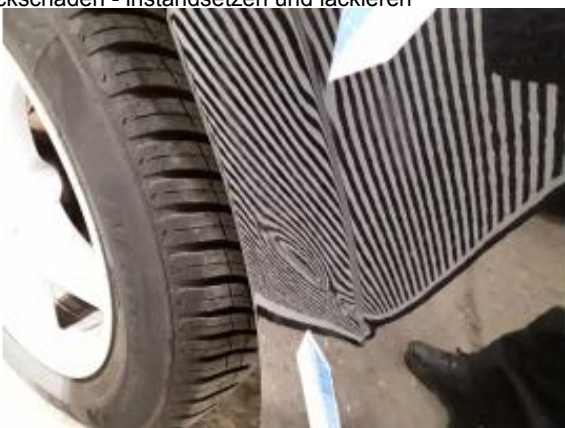
Beschädigung 9: Tür hinten rechts: Tür - Delle / Lackschaden -