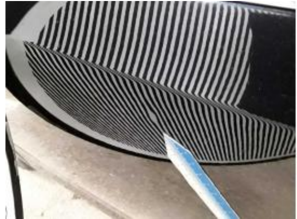
Beschädigung 4: Tür vorn links: Tür - Dellen - sanft instandsetzen