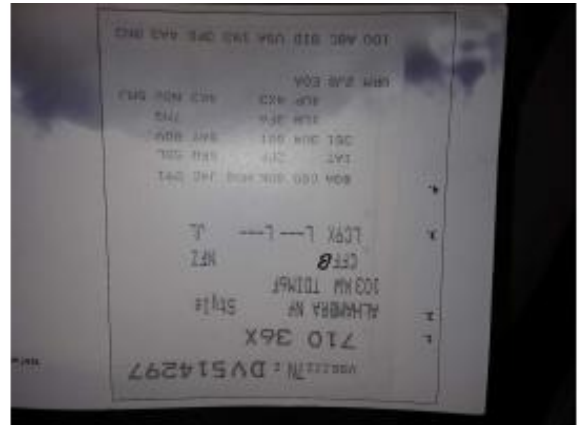
Abbildung 20: Fahrzeugdokumente