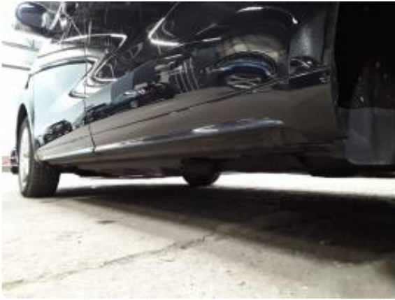
Abbildung 25: Schweller