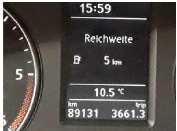
Abbildung 8: Innenraum