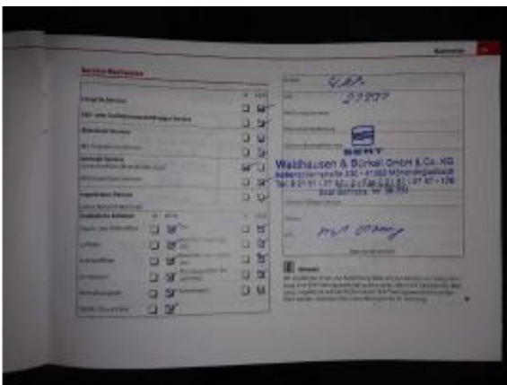
Abbildung 21: Fahrzeugdokumente