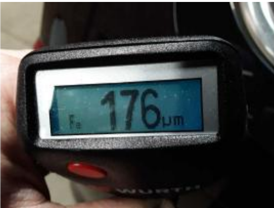
Nacklackierung 1: Seitenwand rechts, Tür vorne rechts