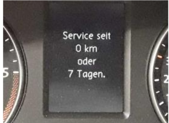
Abbildung 12: Innenraum