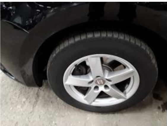
Abbildung 15: Räder/Reifen