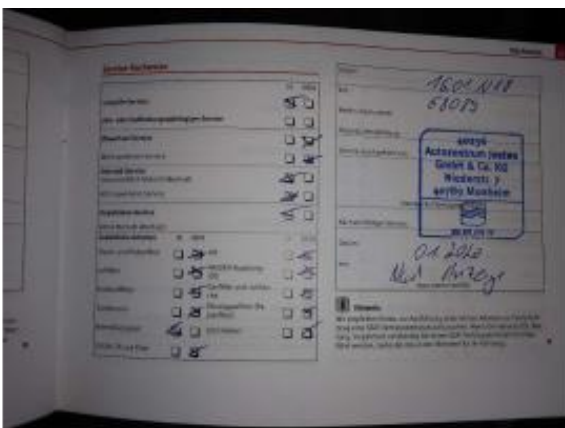
Abbildung 23: Fahrzeugdokumente