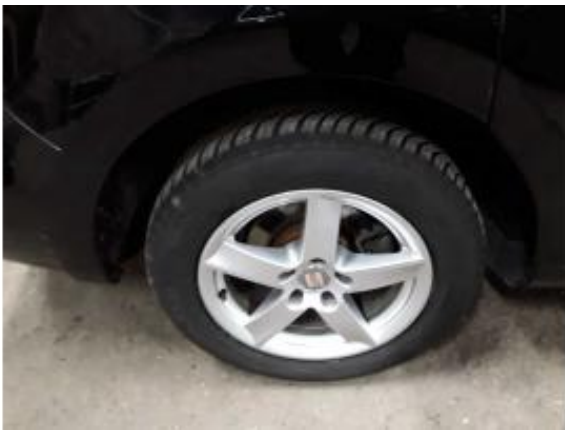
Abbildung 17: Räder/Reifen