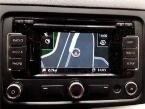
Abbildung 11: Innenraum