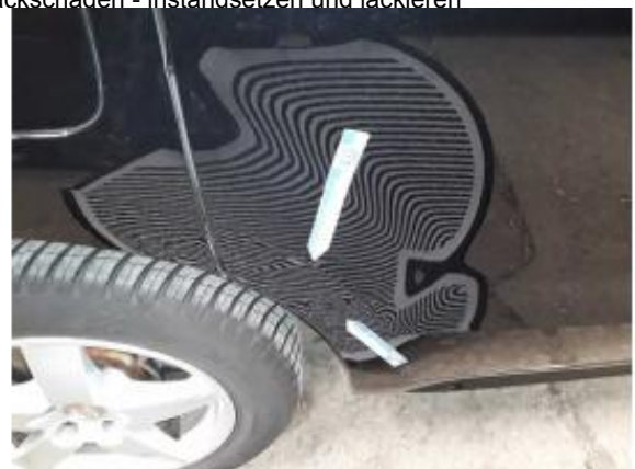
Beschädigung 9: Tür hinten rechts: Tür - Delle / Lackschaden - instandsetzen und lackieren