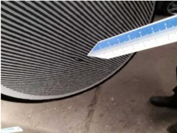
Beschädigung 7: Tür hinten links: Tür - Delle / Lackschaden - instandsetzen und lackieren