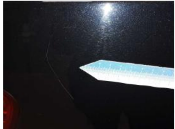
Beschädigung 1: Heckklappe/-tür: Heckklappe - Kratzer - auslegen / polieren