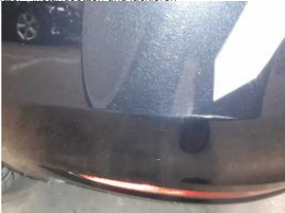
Beschädigung 10: Stossfänger hinten: Stossfänger hinten - Kratzer - instandsetzen und lackieren