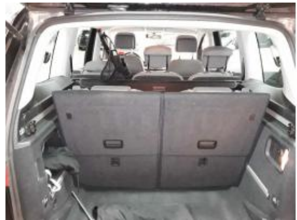
Abbildung 6: Innenraum