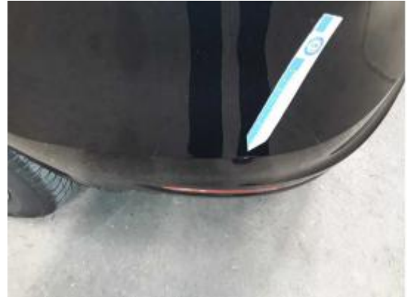
Beschädigung 10: Stossfänger hinten: Stossfänger hinten - Kratzer - instandsetzen und lackieren