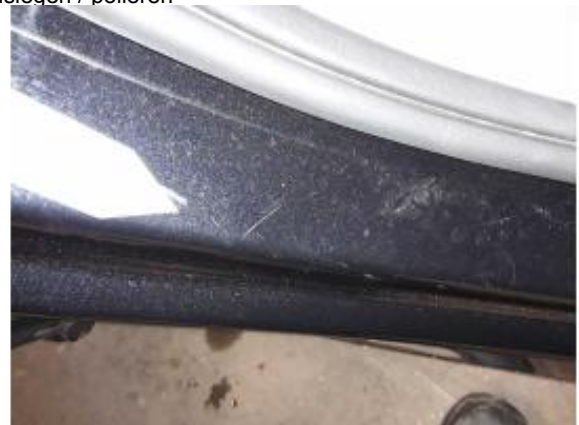
Beschädigung 3: Schweller rechts: Einstieg - Kratzer - auslegen / polieren