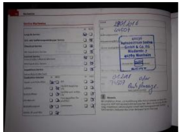
Abbildung 22: Fahrzeugdokumente