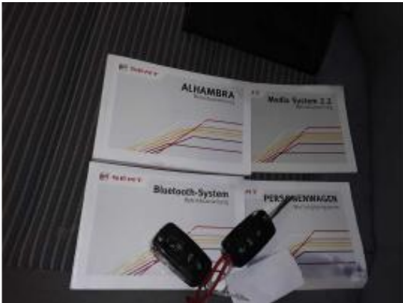
Abbildung 19: Fahrzeugdokumente