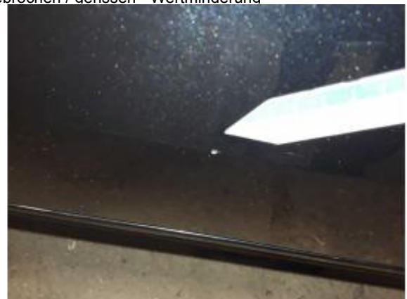
Beschädigung 7: Tür hinten links: Tür - Delle / Lackschaden - instandsetzen und lackieren