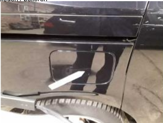
Beschädigung 2: Kraftstoffanlage: Tankdeckel - Kratzer - auslegen / polieren