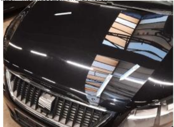
Beschädigung 11: Motorhaube: Motorhaube - Delle / Lackschaden - instandsetzen und lackieren