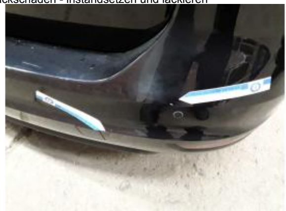
Beschädigung 10: Stossfänger hinten: Stossfänger hinten -