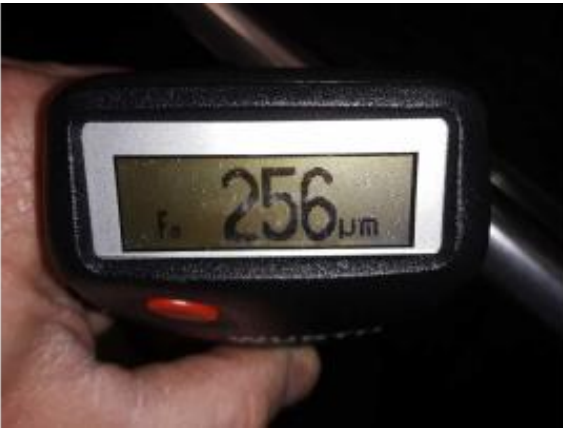
Nacklackierung 1: Seitenwand rechts, Tür vorne rechts