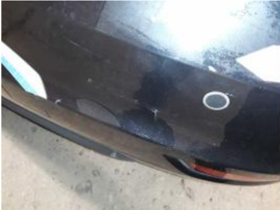
Beschädigung 10: Stossfänger hinten: Stossfänger hinten - Kratzer - instandsetzen und lackieren