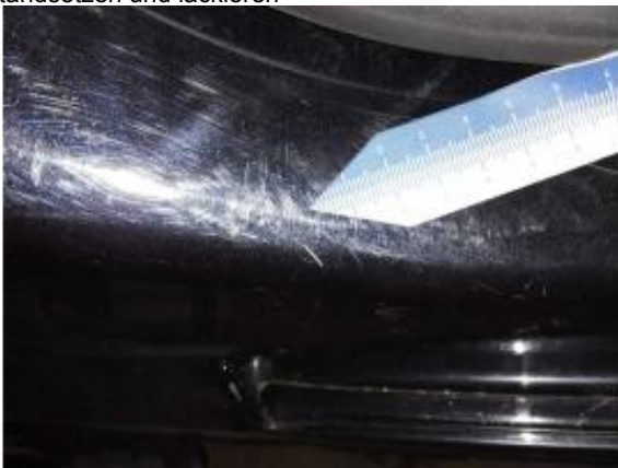
Beschädigung 8: Seitenwand links: Einstieg - Delle / Lackschaden - instandsetzen und lackieren