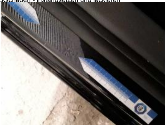
Beschädigung 8: Seitenwand links: Einstieg - Delle / Lackschaden - instandsetzen und lackieren