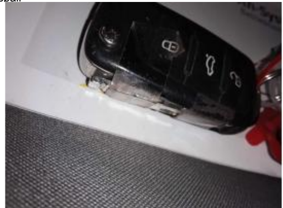
Beschädigung 6: Ausrüstung: Fahrzeugschlüssel - gebrochen / gerissen - Wertminderung