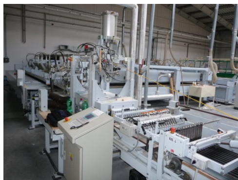
Lepící lisy na laťovkový střed, Torwegge PMR 291.12