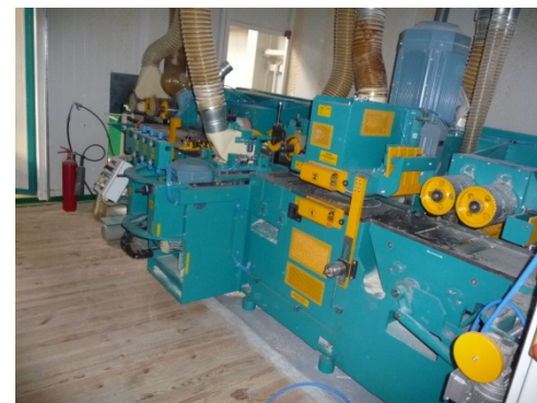
Ledinek Rotoles 300 4V