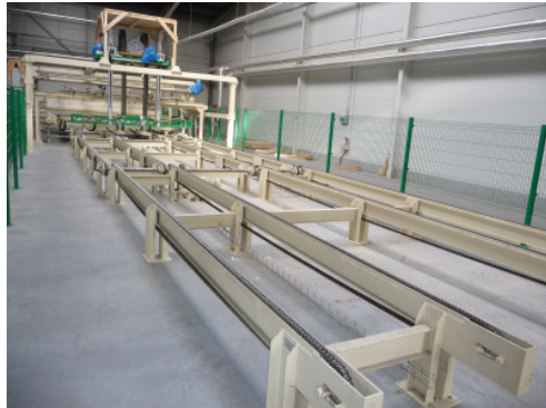
Zuführung zur Ledinek Rotoles