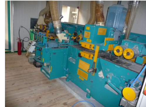
Ledinek Rotoles 300 4V